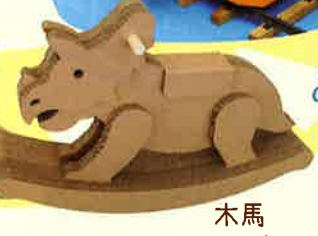
木馬 トリケラトプス