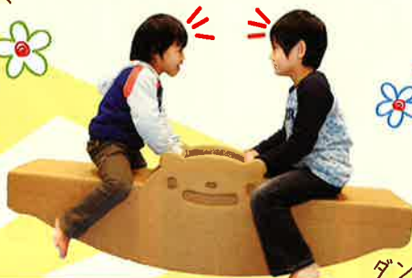
ダンボール シーソー