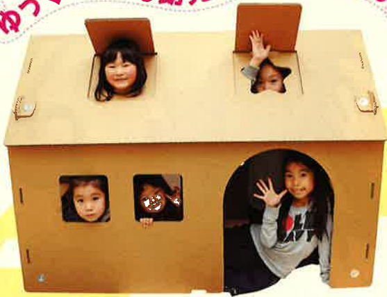
ダンボールハウス