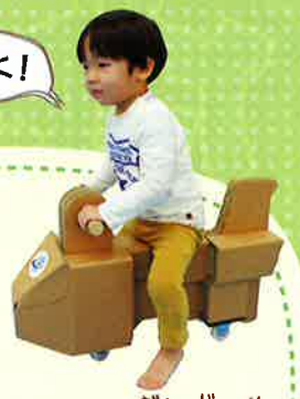
ダンボールカート