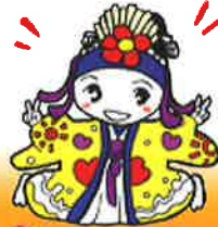
4T ゆいワークキャラクター ゆいちゃん